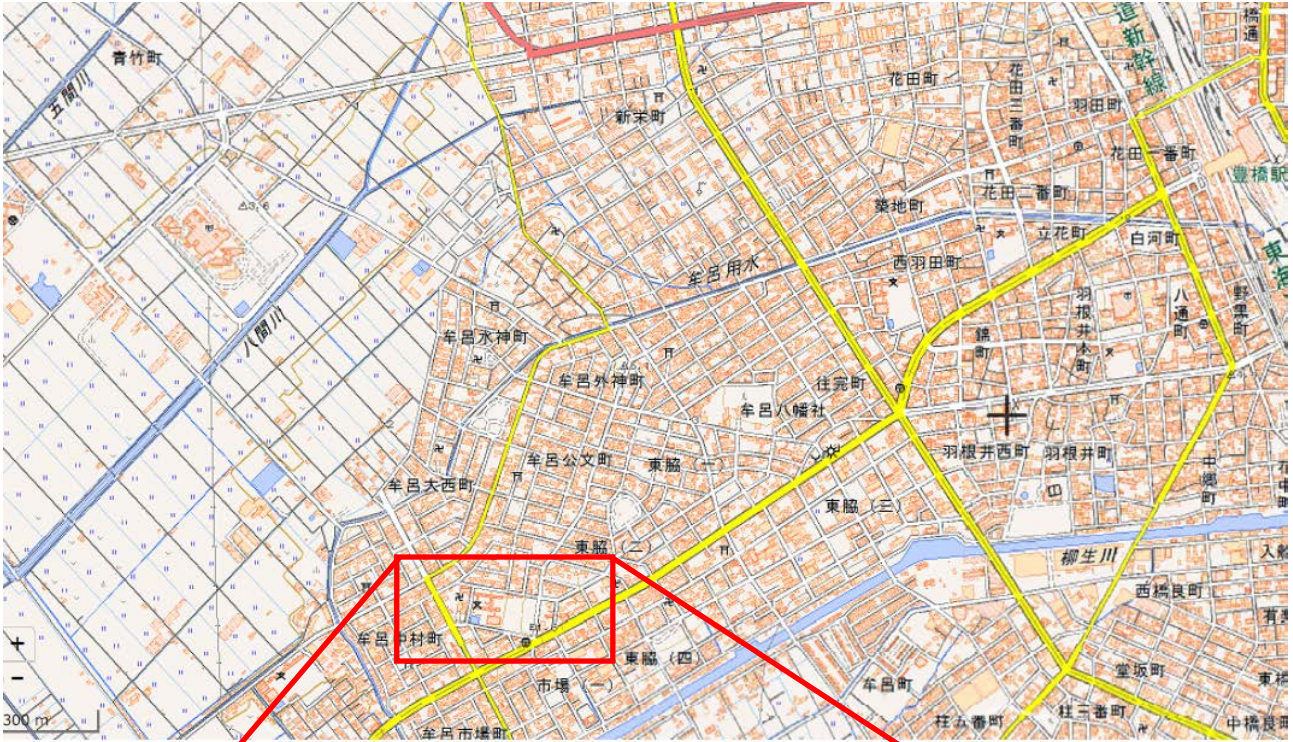
国土地理院地図 電子国土 web( http://maps.gsi.go.jp )を基に中部地方整備局作成