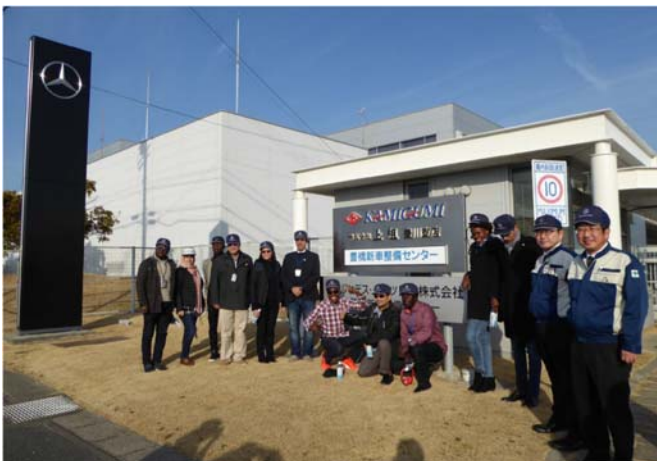
メルセデス・ベンツ日本(株) 新車整備センター