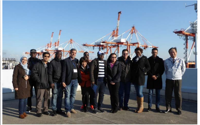
飛島ふ頭南側コンテナターミナルにて