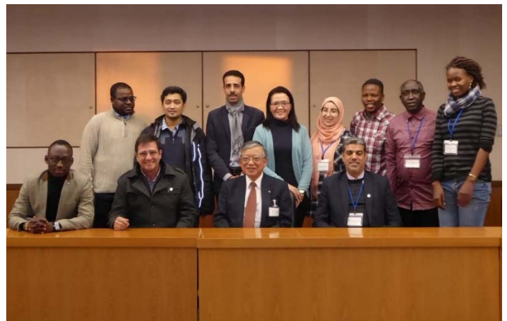
豊橋市長を表敬訪問