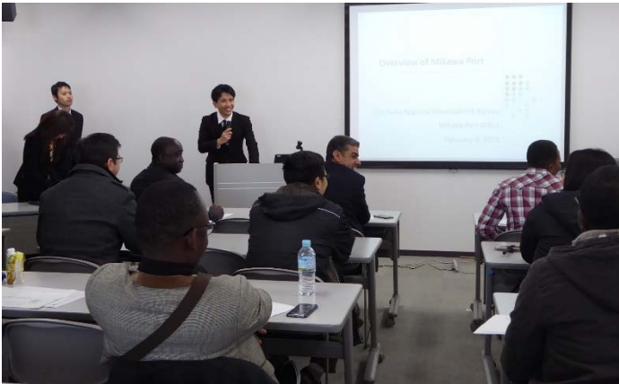
三河港湾事務所 所長より挨拶