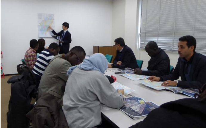
名古屋港の概要説明を聞く研修員