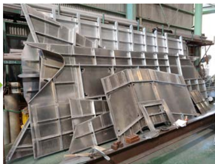
②組み立て部材加工