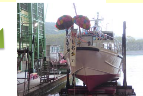
⑦竣工式も無事に終わりました(R3.3.16)