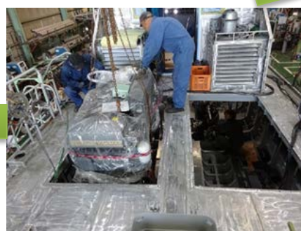
④主機関(エンジン)搭載