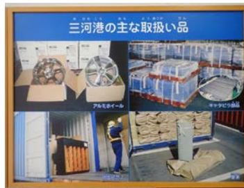
コンテナの中の貨物 (カモメリア展示物より)