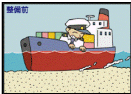
浚渫前（当事務所HPより）