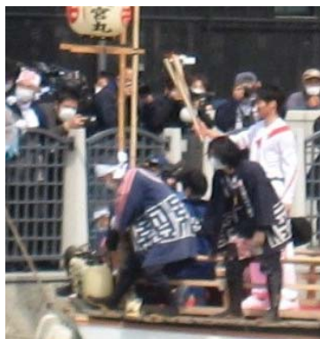
聖火を次に繋ぎます