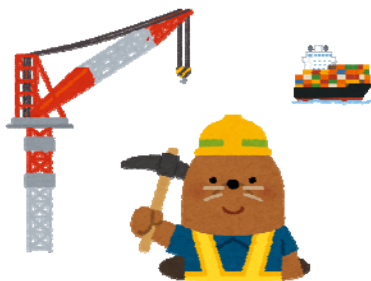
読み札【し】（表）取り札【し】（裏）

浚渫を行うことで、大型船が航行できるようになると、一度に大量の貨物を運ぶことができるようになり、輸送コストの削減などのメリットがあります。