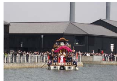
聖火をのせて半田運河を渡ります

衣浦港事務所がある半田市では、聖火ランナーが「ちんころ舟」に乗って半田運河を渡る、貴重な光景が見られました。