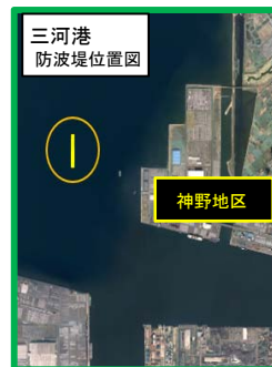
三河港防波堤工事予定箇所 昨年度防波堤整備状況