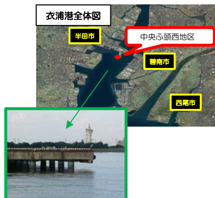
岸壁断面の拡大写真

木材チップ等の需要増加に伴う岸壁の利用増が予想される一方、施設が老朽化しているため、中央ふ頭西地区岸壁(-12m)の補修を行っています。補修を行うことで、岸壁の利用増に対応出来るようになります。