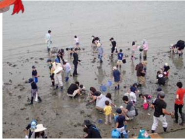
生きもの調査全体の様子

6月13日(日)に市民ボランティア団体「渡し場かめ会」が主催の「高浜の干潟の生きもの調査」に参加させていただきました！