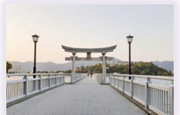
竹島側から見た美しい景観