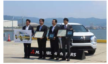
感謝状授与の様子

三河港は自動車の輸入台数で日本一、輸出台数は名古屋港に次いで全国2位となっており、日本の自動車輸出入拠点として重要な役割を果たしています。背後地域に国内有数の自動車メーカーの組立工場や輸入自動車基地が立地しており、自動車輸出入拠点として重要な役割を果たしています。