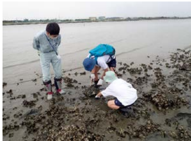
何か見つけたかな？

生きもの調査の後、子供たちは捕まえた生きものについて興味津々に質問をしたり、説明を熱心に聞いたりしていました。子供たちにはこれをきっかけに環境を大切に、生きものを守ろうという気持ちを育んでもらいたいです。