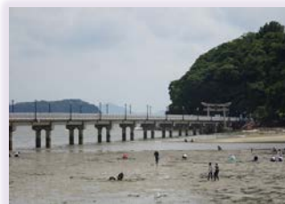
竹島海岸での潮干狩り