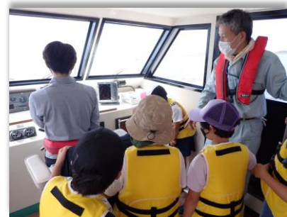
船に乗って港を見学!