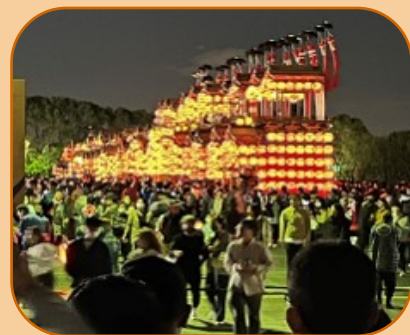
提灯に灯された31輛の山車