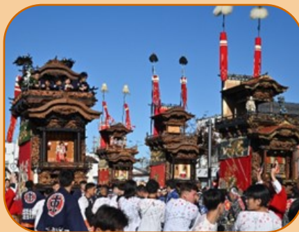
JR半田駅前での供覧