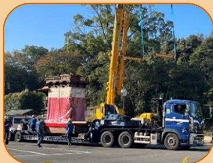
トレーラーで運搬された山車

4年後の2027年には、第10回目となる『はんだ山車まつり』が開催されるとのことで、もうすでに待ち遠しいですが、地区毎の春祭りは毎年実施しているので、その春祭りにも足を運んでみたいと思います。