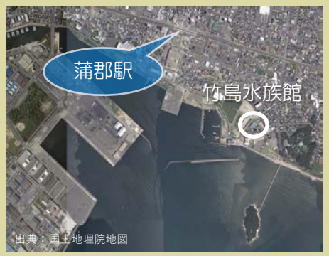
竹島水族館 位置図

そんな三河湾に関わりの深い水族館である竹島水族館は3月31日（日）まで4月のリニューアルオープンに向けた工事を行っています。 竹島水族館について知りたい方はHPをご覧ください。