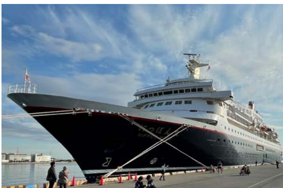
衣浦港に寄港した「にっぽん丸」

衣浦港への客船の寄港は初めてでしたが、これからも様々な船の利用により衣浦港がにぎわってほしいです。