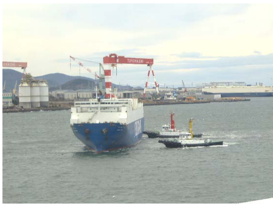
貨物船を誘導している様子

港の縁の下の力持ちであるタグボートが集まってきたら、大型船の入出航が近い合図かも？ 港の近くに来た際は、大型船の近くにいないか探してみてください。