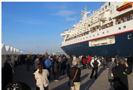
お見送りに訪れた多くの人たち