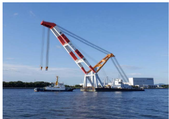
起重機船を引っ張っている様子