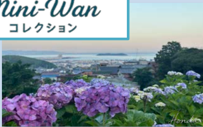
形原温泉あじさいの里：6月