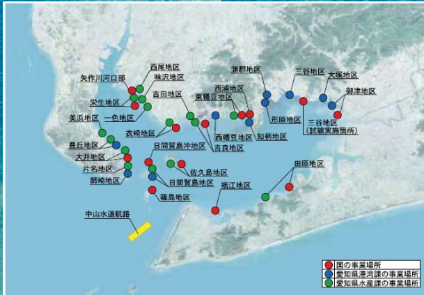
三河湾内で人工干潟等を造成した箇所

モニタリングの結果、水質・低質の改善が見られ海生生物・鳥類の多様化など多大な効果が見られました。これからも三河湾の環境を守りつつ、三河湾の整備を進めてまいります。