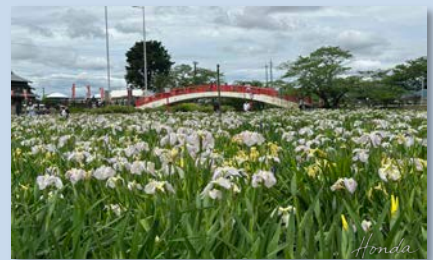
賀茂しょうぶ園：6月