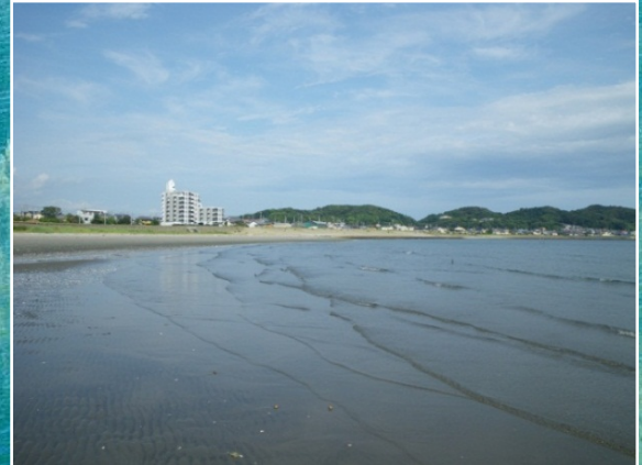
人工造成干潟（蒲郡市）