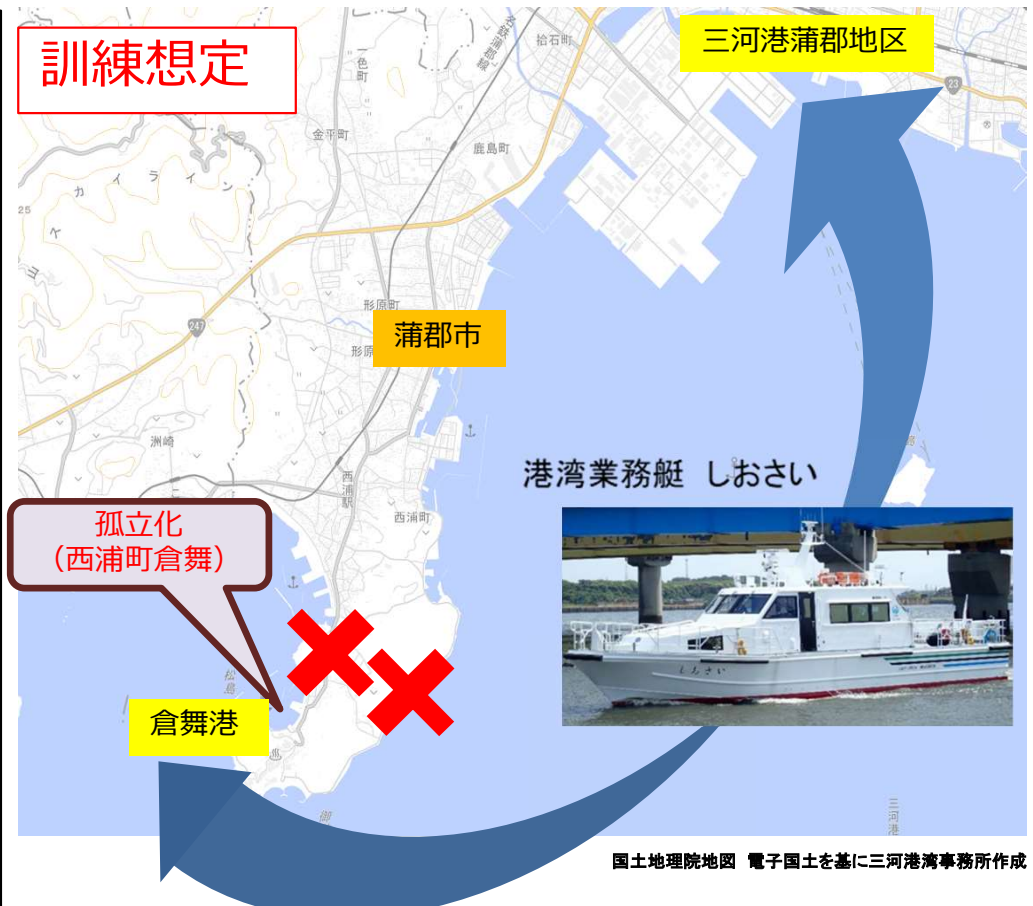
国土地理院地図 電子国土を基に三河港湾事務所作成