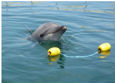
日間賀島ドルフィンビーチ