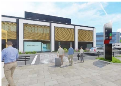
師崎港観光センター※イメージ図