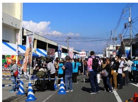
地域振興イベントの開催状況 (Sea級グルメ全国大会in沼津)