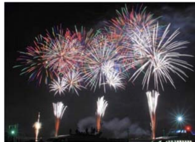
篠島ぎおん祭り(花火大会)