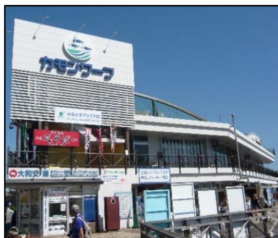
構成施設のイメージ (下関港、カモンワーク)