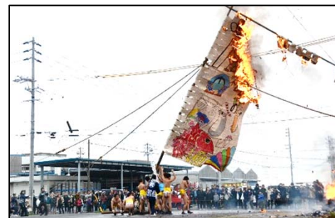
師崎左義長まつり