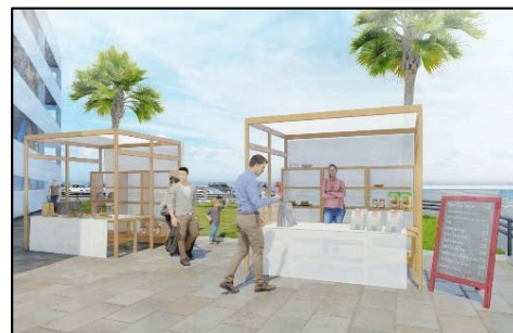
師崎港観光センターマルシェ