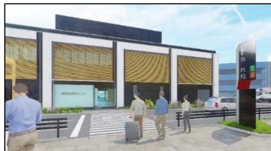
師崎港観光センター