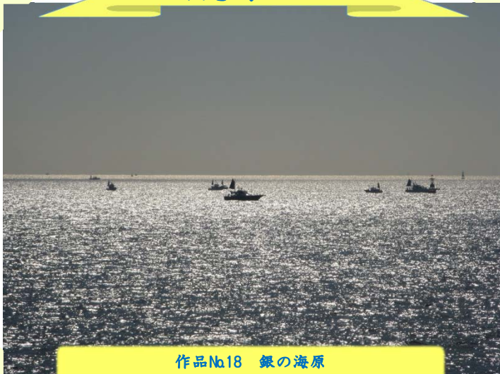
作品No.18 銀の海原 (伊勢湾フェリーからの風景)