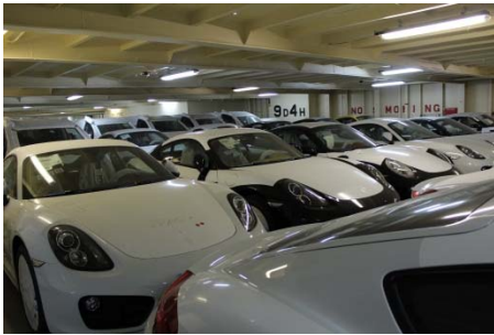
上)三河港に係留中の大型PCC船 下)PCC船内部

三河港の臨海部及び周辺地域には世界有数の自動車産業が集積しているため、三河港は日本の完成自動車輸出入拠点として重要な役割を果たしています。三河港における2012年の自動車取扱台数は輸出では約85万台（全国2位）、輸入では約14万台（20年連続全国1位）となるなど、多くの自動車を取り扱っています。