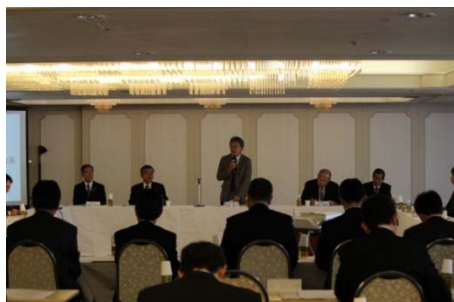
会議の様子(上:24日衣浦港 下:25日三河港)

昨年12月に、衣浦港(24日(火):半田市内)、三河港(25日(水):豊橋市内)にてそれぞれ第6回の地震・津波対策検討会議が開催されました。