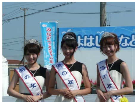
ミスみなとの御三方