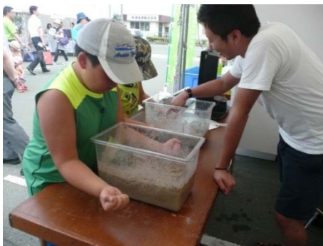
液状化の仕組みの実験中

当事務所もブースを出展し、東日本大震災を風化させない取り組みとして震災時の様子、国土交通省の対応を紹介するパネル展示やビデオ放映を行いました。また、地震によって起きる津波や液状化の仕組みを分かりやすく知っていただくために模型を使った津波実験と液状化実験も併せて行いました。来場者の方からは今回の実験を体験することによって、津波や液状化の仕組みがよく理解できたのと同時に、改めて地震の怖さを感じたという感想も聞かれました。