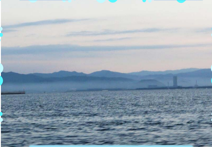
作品No25 あさや 朝霧の中の三河湾