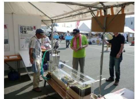
当事務所ブースを見学する佐原豊橋市長