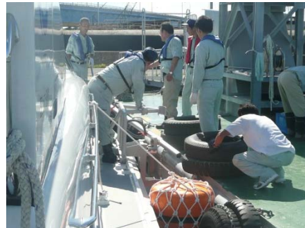
探査装置取付訓練中

地震や津波などの災害時には、流木やコンテナ等が港内まで流れ込み、海底に沈んでしまうことがあります。もし海底に障害物がある場合、災害後に緊急物資を積んだ船舶がスムーズに航行できず、早期復興に支障をきたす可能性があります。そのため、海底地形探査装置（以下、探査装置）などの測量機械を使用して、航路内の海底に障害物があるかを探査することにより、船舶の安全な交通を確保する必要があります。