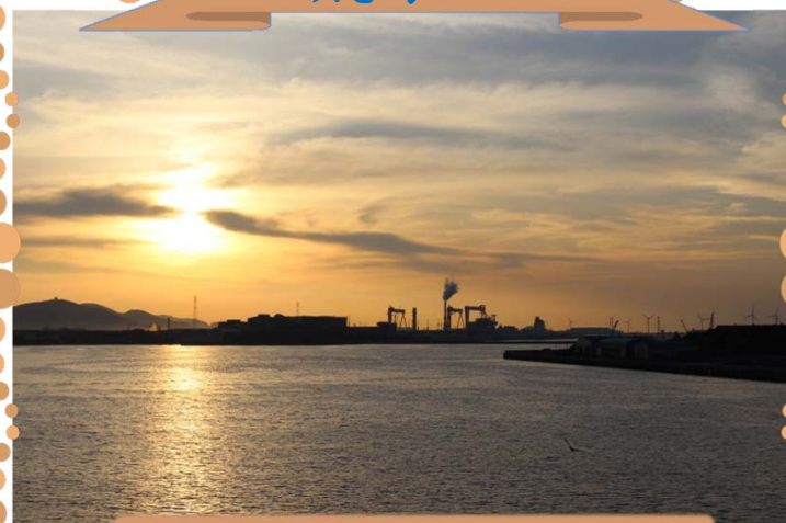
作品No27 夕暮れの三河港 (港大橋から)