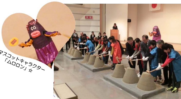
★マスコットキャラクター「ムロロン」★

三河港で起こりうる最大級の地震が発災した際に、発災直後から緊急物資の輸送や、経済活動の確保を目的とした、通常の岸壁よりも耐震性を強化した係留施設。三河港は耐震強化岸壁が3カ所整備・計画されており、今回整備する神野地区の耐震強化岸壁は豊橋市を中心とした背後地域をカバーすることになります。