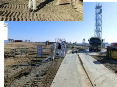
作業状況見回り中