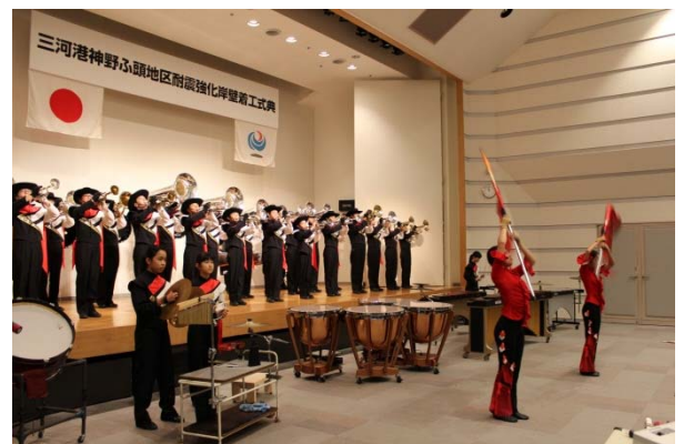
つつじが丘ジュニアマーチングバンドによる演奏