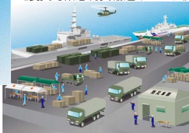
《震災時緊急物資輸送イメージ》