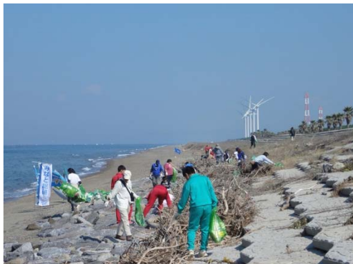
ゴミを集める参加者の方々