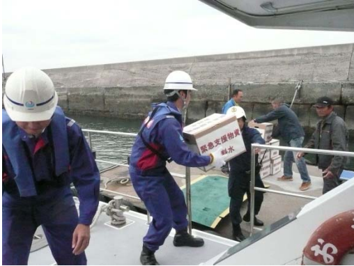
物資の陸揚げ訓練の様相

11月5日（水）に「平成26年度 内閣府・西尾市 地震・津波防災訓練」が開催され、当事務所も参加しました。この訓練は、南海トラフ巨大地震に備えて、内閣府の共催のもと、市民、自主防災組織、防災関係機関、学校、病院、民間企業、ボランティア団体等と一体となり、全市民参加による総合的かつ実践的な防災訓練を実施することにより、地震災害に対する防災体制の確立及び市民の防災意識の高揚を図ることを目的として行われました。