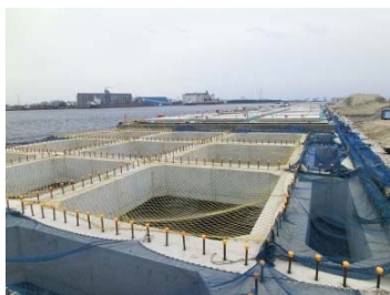
上部コンクリート打設後

今年度の工事では、岸壁の棧橋部分では撤去工や上部工等、護岸部分では地盤改良工等を実施しています。現在では作業も終盤に差し掛かっているところですが、最後まで受注者の方々がより安全に作業し、より高品質の施設を整備できるよう努めていきます。