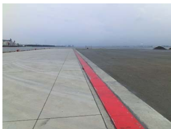
工事完了イメージ (過年度の完成部分)