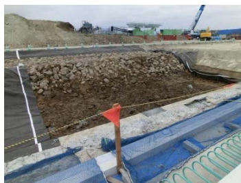
地盤改良のための土砂掘削