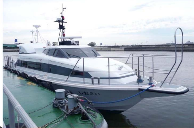
作品No.38 港湾業務艇 「しおさい」