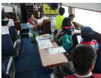
船上から見学の様子