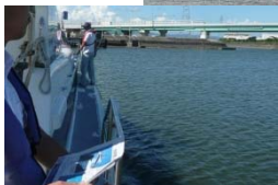
三河湾見学の様子