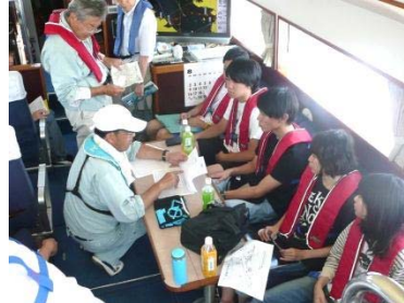
「しおさい」内で講義

台風の影響により開催も危ぶまれましたが、当日は好天に恵まれ、学生の皆さんは船上で実際に採水器具や採泥器具を使って楽しみながら研修に取り組んでいました。また、水産試験場において当事務所職員と水産試験場職員からの三河湾の環境についての講義も熱心に聴いていました。