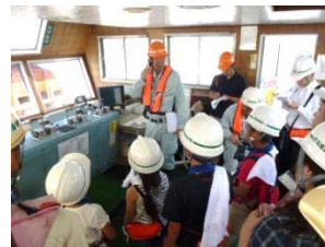
浚渫船見学の様子