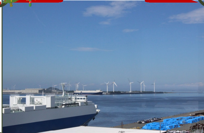
作品No.40 PCC船と (神野ふ頭)