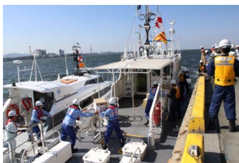
緊急物資海上輸送