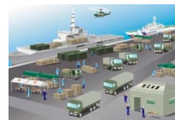
＜緊急物資海上輸送イメージ＞

三河港BCP の詳細につきましては、愛知県三河港務所のホームページにてご確認ください。 http://www.pref.aichi.jp/kensetsu-somu/mikawa-komu/