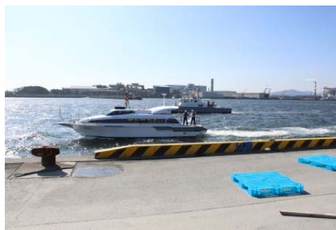
港湾施設点検・被災状況調査