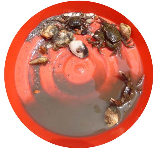
捕まえた生きもの アサリ、カニなど