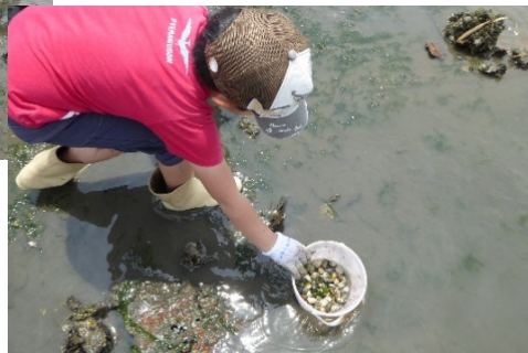
アサリをたくさん捕まえました。