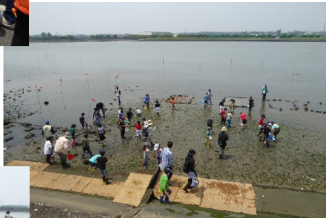
調査開始。参加者の皆さんが 干潟のなかへ。