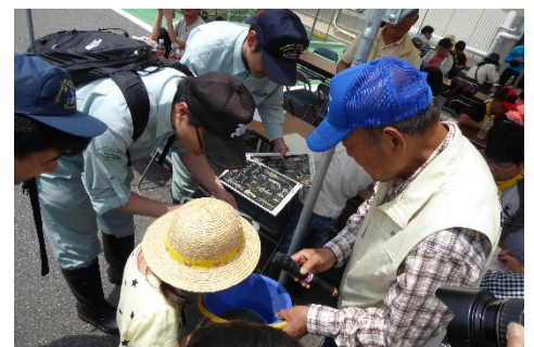
当事務所職員による解説