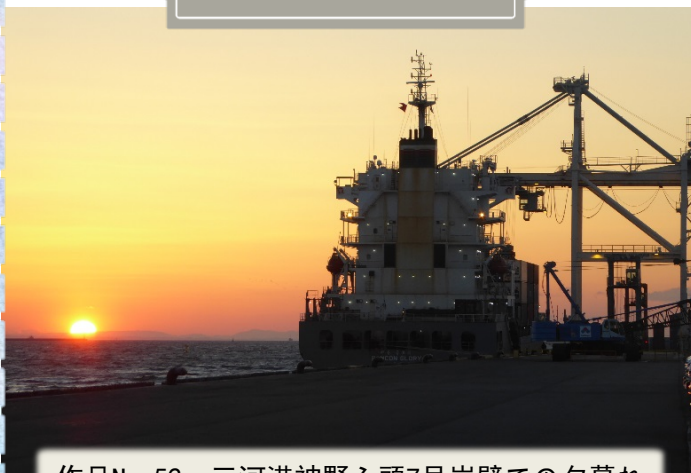
作品No. 52 三河港神野ふ頭7号岸壁での夕暮れ