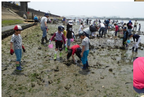
皆さん真剣に生きものを 探しています。