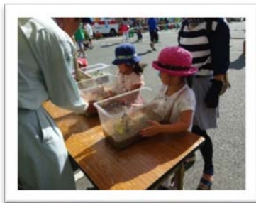
液状化実験の様子