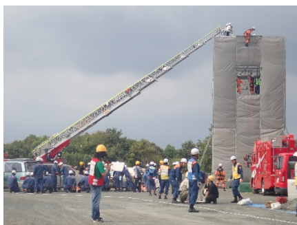
はしご車を使った訓練の様子 (メイン会場)

吉田方小校区は地盤の低さが低いこと、また翌週に台風の上陸が予想されていたこともあり来場者の関心が高く、たくさんの方に熱心に見学頂きました。