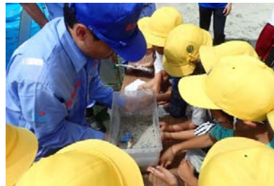
液状化実験の様子

津波と液状化について、地域の皆さんに危険であることを再確認して頂き、防災意識の向上につなげられたのではないかと思います。