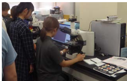
研修室での観察の様子

8月29日（水）、名城大学の学生を対象とした海洋環境実習を行いました。午前中は当事務所の港湾業務艇「しおさい」に乗船し、三河湾の水質や底質の状況について、愛知県水産試験場の職員から環境観測の項目や測定方法の説明を聞き、学生らが実際に測定機器を操作して、三河湾の湾奥部から湾口部までの各地点において観測しました。また、観測に合わせて、当事務所職員から三河港の荷役について説明を行い、自動車運搬船への積み込み状況も船上から見る事ができました。