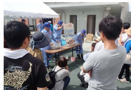
パネルによる説明の様子

津波の模型実験では、一度の地震で何度も波が来ることに驚かされている様子でした。液状化の模型実験では、興味津々に覗き込むようにご覧になっていました。体験して頂いた方々からは、「波の種類によって性質が全然違うね」、「液状化が起これと空洞で軽いマンホールは浮き上がるんだね」といった声が聞かれました。