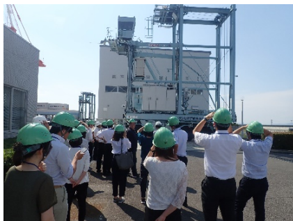
三河港にある港湾技能研修センターの見学の様子