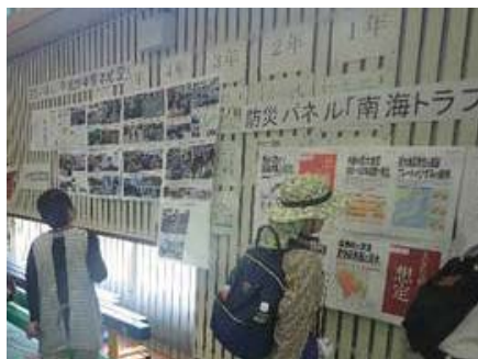
多くの見学者が訪れた事務所ブース(吉田方小学校会場)