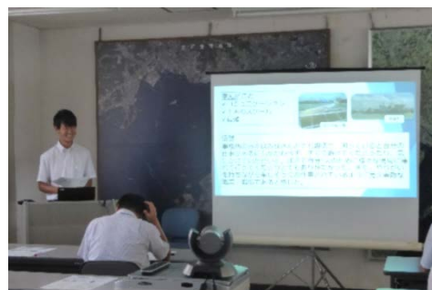
実習最終日の報告会の様子

当事務所では、今後も、就業体験実習生の受け入れを積極的に行っていきたいと思います。