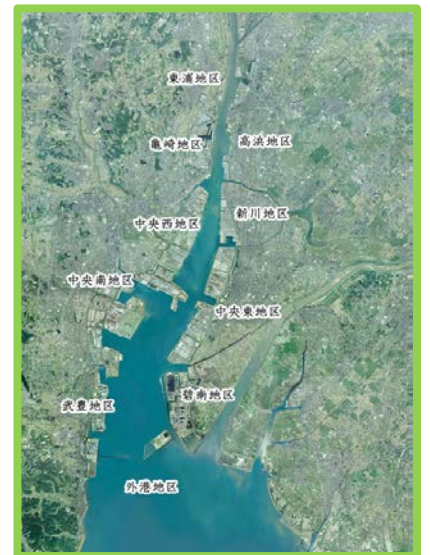
衣浦港周辺空撮写真

こうした背景から、物流機能の充実や船舶の大型化への対応が求められており、航路等の整備を進めています。また、老朽化した施設の機能回復・機能強化を目的とした施設改良も実施しています。