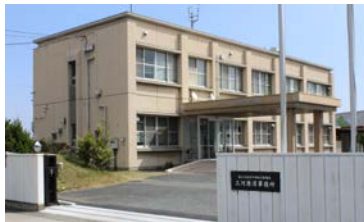
三河港湾事務所庁舎

現在、当事務所では、物流の効率化や船舶の大型化への対応、また、大規模地震時の物流機能の確保や、企業活動の継続及び早期復興を可能とするため、神野地区において岸壁や防波堤等の整備を進めています。