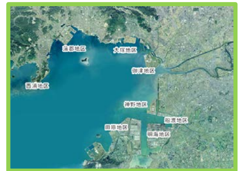
三河港周辺空撮写真

三河港は、三河湾の東側湾奥部に位置し、港湾区域として周囲約80km、水域面積約132平方キロメートルを有する港です。日本のほぼ中央に位置することから、全国に向けた物流の結節点として優位であり、中部地域の基幹産業である自動車を中心とした「ものづくり」を支える物流拠点となっています。特に三河港の完成自動車の取扱は、輸入台数・金額共に27年連続で全国一位を誇ります。輸出においても、金額は8年連続、台数は3年連続で全国二位となっています。（令和元年の数値、財務省貿易統計より）。