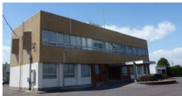
衣浦港事務所庁舎

衣浦港は三河湾の西側湾奥部に位置し、愛知県の知多半島と西三河地域に挟まれた南北約20kmにわたる細長い水域を有する港です。 臨海部に造成された工業用地には、窯業、化学工業、及び食品関連企業その他、発電所や製鉄所などの基幹産業や、自動車・航空機などの高度産業が集積しています。