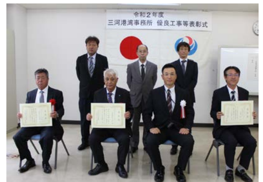
受賞者の皆様と事務所関係者の集合写真

三河港湾事務所ホームページ http://www.mikawa.pa.cbr.mlit.go.jp