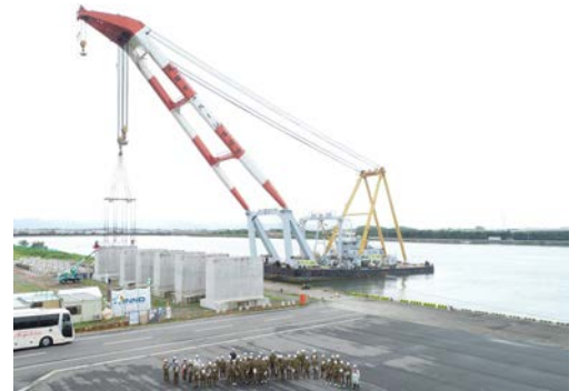
起重機船とケーソンを背景にドローンでの撮影