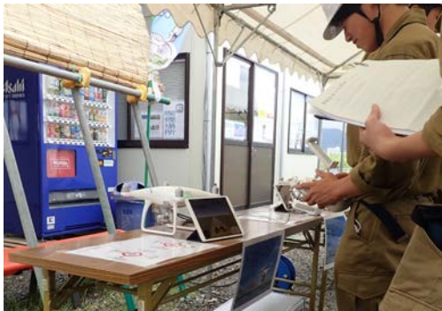
仮想空間でのドローン操作を体験