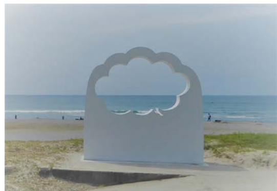
表浜海岸「エールオブジェ」

表浜海岸とは伊良湖岬から東へ約50キロ続く海岸を指します。『エール』の撮影は表浜海岸の中の「伊古部（いこべ）海岸」付近で撮影されており、8月2日（日）には「エールオブジェ」が設置されました。